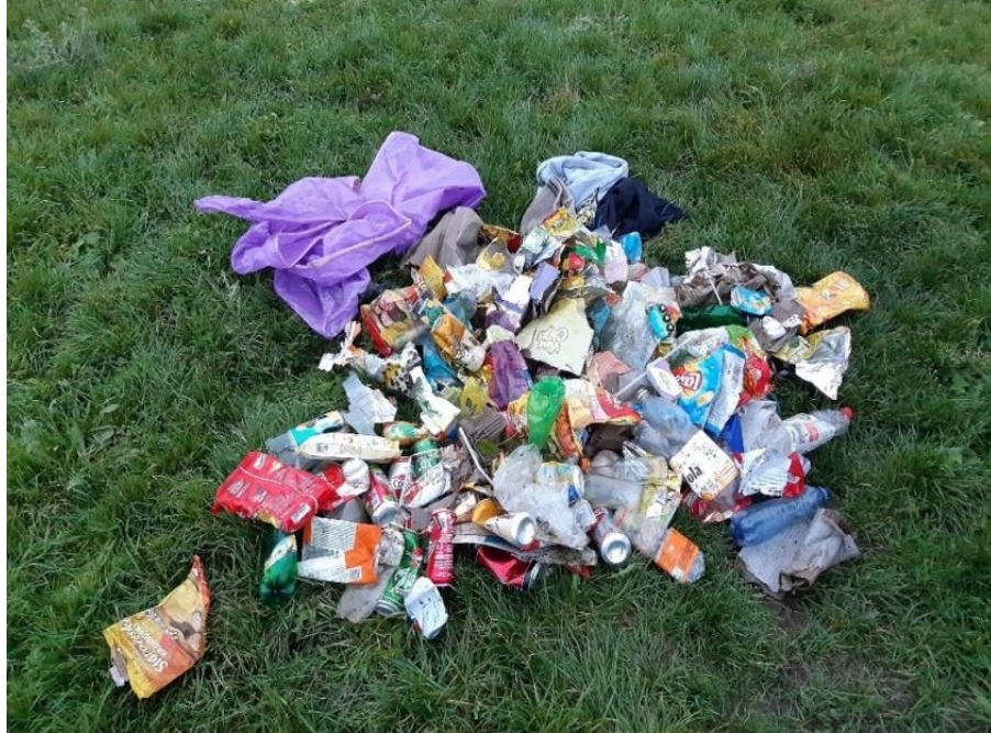
Odpad v přírode