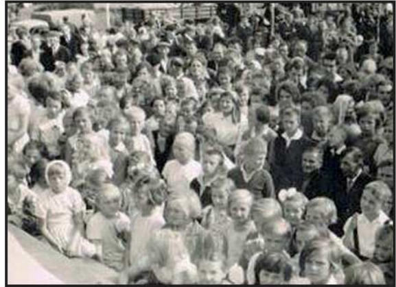
Dożynki na placu szkolnym - rok 1962 (ze zbioru p. Janusza Malinowskiego).