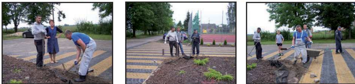
25 czerwca 2014 r. – wykonanie obrzeży wokół klombu przed budynkiem szkoły.