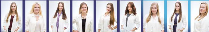
Evka Diana Dia Ajka Dery Dia Žana Anet Mižu