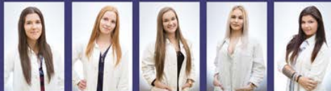
Sjma Seška Seška Pačka Nika