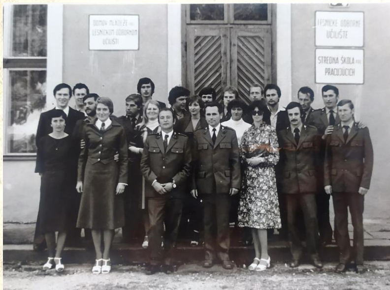
V kronike sa píše...