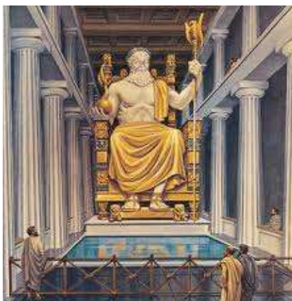
Socha boha Dia, Olympia, Grécko