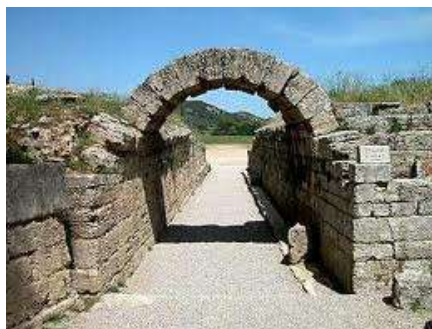
Vstupná brána olympijského štadióna, Olympia, Grécko