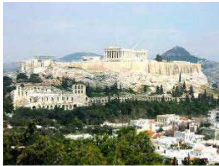
Akropola, Atény, Grécko