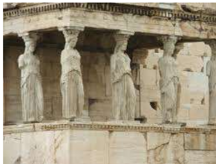
Chrám Erechteion – stĺpy Kyriatidy, Atény, Grécko