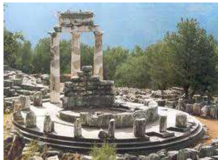
Tolos, veštiareň, Delfy, Grécko