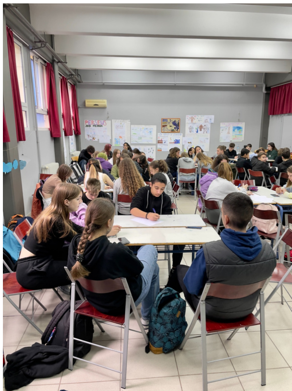
Zdroj: Michal Jančík