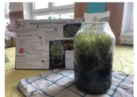
Zdroj: Adéla Látalová