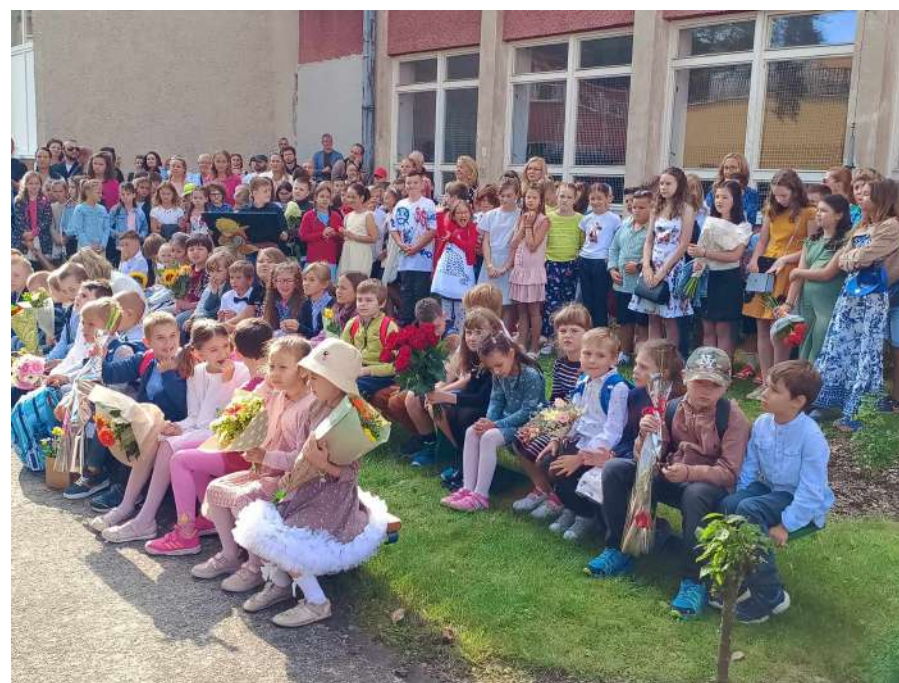
Úspešný začiatok školského roka 2023/2024