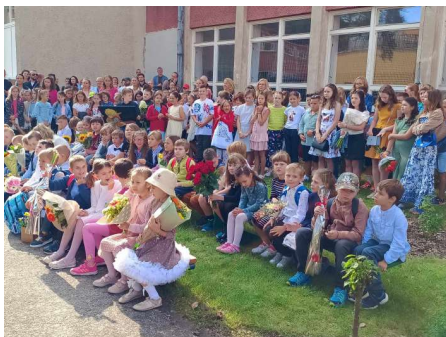
Začiatok školského roka 2023/2024