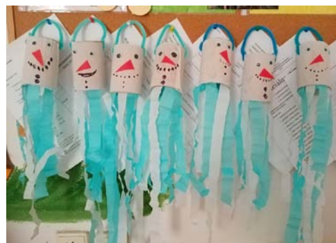
Výtvary detí zo ŠMŠ